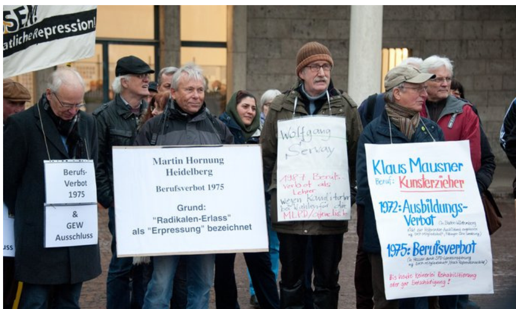
Kundgebung mit Betroffenen des sogenannten Radikalenerlasses auf dem Stuttgarter Schlossplatz (hier 2014)