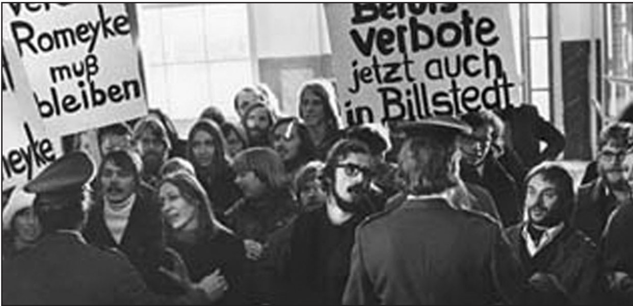
Filmszene: Solidarität der Kolleg:innen und Eltern

zum Thema „Arbeit“. Vom ortsansässigen Fabrikanten Gaub besorgt sich Vera die Genehmigung für eine Fabrikbesichtigung mit ihren Schüler:innen. Zum ersten Mal erleben sie aus nächster Nähe Fließband-Produktion und beobachten ihre Väter bei der Arbeit. Wieder in der Schule werden die gesammelten Erfahrungen in einem Planspiel aufgearbeitet, dessen Mittelpunkt eine simulierte Fließbandarbeit bildet und in dessen Verlauf einige Schüler:innen beginnen, sich über die niedrige und ungleiche Bezahlung zu empören.