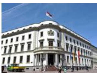
Neues "E" hängt: Schriftzug am Landtag wieder intakt