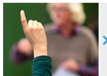
Merkel: Weiterbildung von Lehrern für Digitalisierung