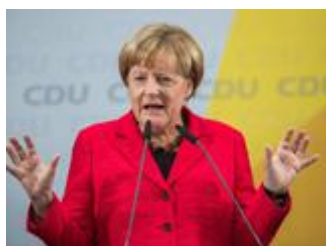
Merkel: Keine neuen Schulden und Steuern